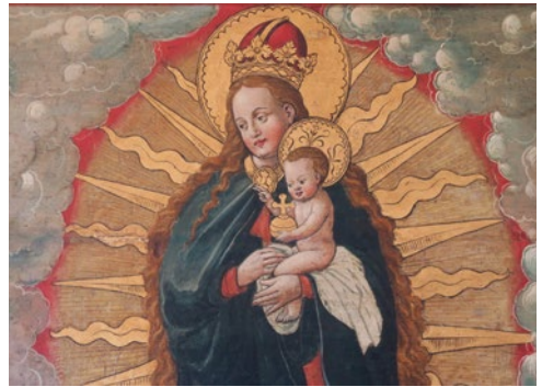
Bildausschnitt aus St. Fridolin.