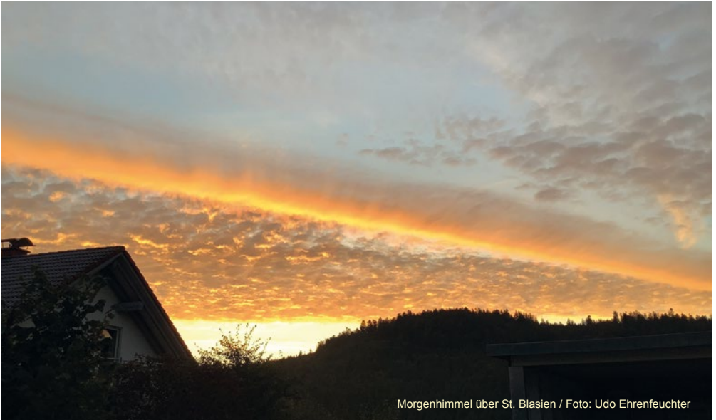
Morgenhimmel über St. Blasien

Wacht und betet allezeit, damit ihr allem, was geschehen wird, entrinnen und vor den Menschensohn hintreten könnt!