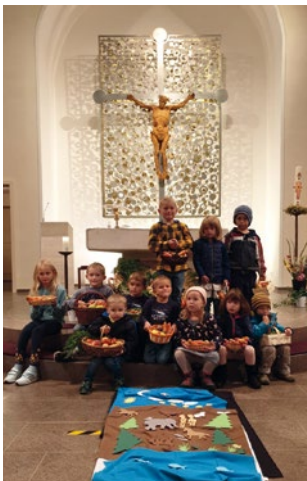
Erntedank in Urberg