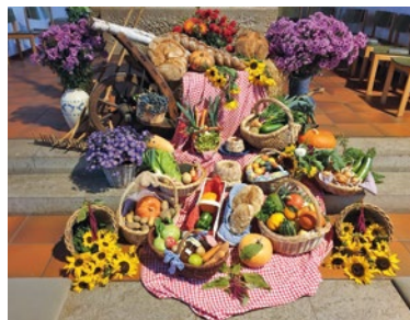
Text und Bild: Johannes Sebulke

Die Frauen des Gemeindeteams hatten zum Erntedankfest wieder einen schönen Erntedankaltar zusammengestellt. Die vielen Früchte und Brote symbolisieren, dass wir alles haben, was wir zum Leben brauchen. Und die kleinen Kuchen deuten an, dass wir vielleicht sogar etwas mehr haben, als unbedingt zum Leben notwendig ist. Der Schubkarren, der Rechen und die Heugabel zeigen an, dass die Ernte durchaus auch mit Arbeit verbunden ist. Aber die Fülle der Gaben, die geradezu vom Altar herunterzuquellen scheinen, zeigen demütig und dankbar an, dass unsere Arbeit von Gott gesegnet war. Auch dieses Jahr. Ein schöner Brauch in Häusern ist es, dass sich nach dem Gottesdienst jeder Gottesdienstbesucher etwas mit nach Hause nehmen darf, z. B. einige Scheiben frisch gebackenes Brot. So hat jeder etwas in der Hand, wofür er dankbar sein kann.